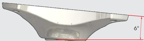
Neigungswinkel 6° nach vorne tilt angle 6° forward